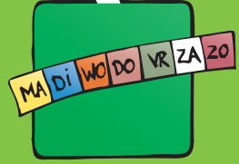
DEZE WEEK DOEN